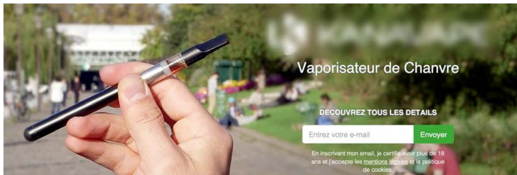
Photo : site commercial internet d'un vaporisateur de Chanvre, 3 janvier 2015