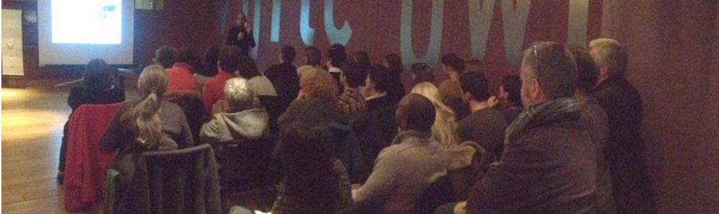
Photo : soirée du 4 décembre 2014 sur le thème "Les médicaments de substitution aux opiacés en milieu carcéral"

La lettre n°43 décembre 2014 www.addictlim.fr