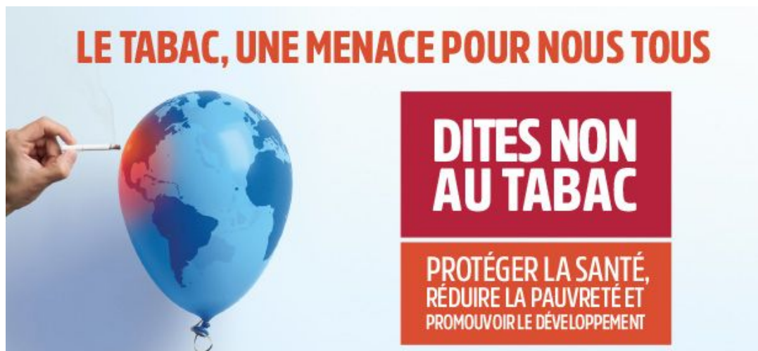
Photo : Affiche OMS pour la journée mondiale sans tabac du 31 mai

L'OMS a institué la "Journée mondiale sans tabac" en 1987 pour faire mieux connaître, partout dans le monde, l'épidémie de tabagisme et ses effets mortels. Le tabagisme est la première cause de mort évitable à laquelle les soignants sont confrontés. Le thème proposé par l'OMS de cette année est "le tabac une menace pour le développement". Depuis l'année dernière, la France a consolidé ses actions de lutte contre le tabagisme avec :